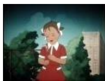
8. «Цветик семицветик»