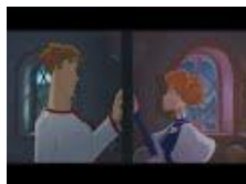
4. Иван Царевич и Серый Волк (Мультфильм)