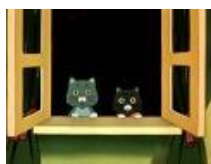
7. «Кошкин дом»