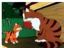
5. Вот так тигр!