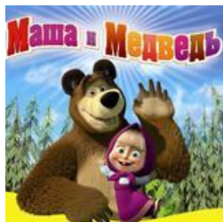
2. «Маша и медведь»