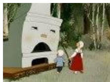
6. «Гуси лебеди»